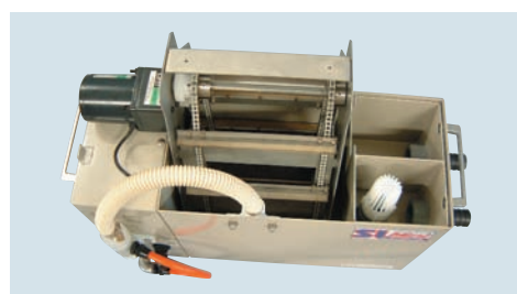
● 掻出しコンベア部