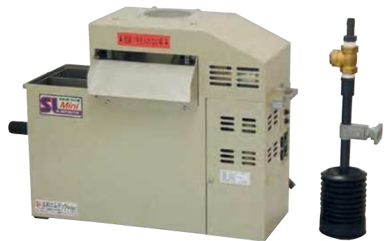
● 掻出しコンベア部