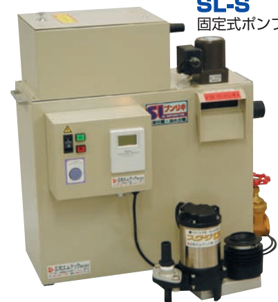
SL-S 固定式ポンプユニット仕様