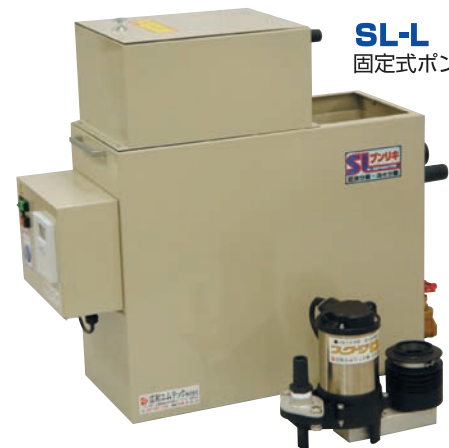
SL-L 固定式ポンプユニット仕様